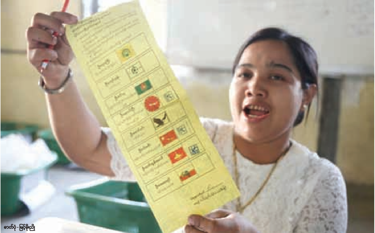
လှိုင်သာယာမြို့နယ်ရှိ မဲရုံတစ်ရုံတွင် ဆန္ဒမဲများကိုရေတွက်ရာတွင် တံဆိပ်တုံး သုံးနေရာထုထားသောကြောင့် ပယ်မဲအဖြစ်သတ်မှတ်ရမည့် ဆန္ဒမဲလက်မှတ်ကို မဲရုံဝန်ထမ်းတစ်ဦးက အများပြည်သူသို့ ပြသနေစဉ်

မဲဆန္ဒနယ်အများစုမှမဲပေးသူ နည်းခဲ့တဲ့ကြားဖြတ်ရွေးကောက်ပွဲ ၈ 12