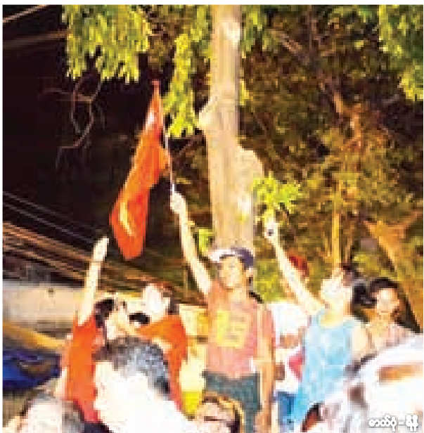
★ ဗဟန်းမြို့နယ် အနောက်ရွှေဂုံတိုင်လမ်းတွင် မဲစာရင်းကြေညာမည်ကို စောင့်ဆိုင်းနေသူများ။