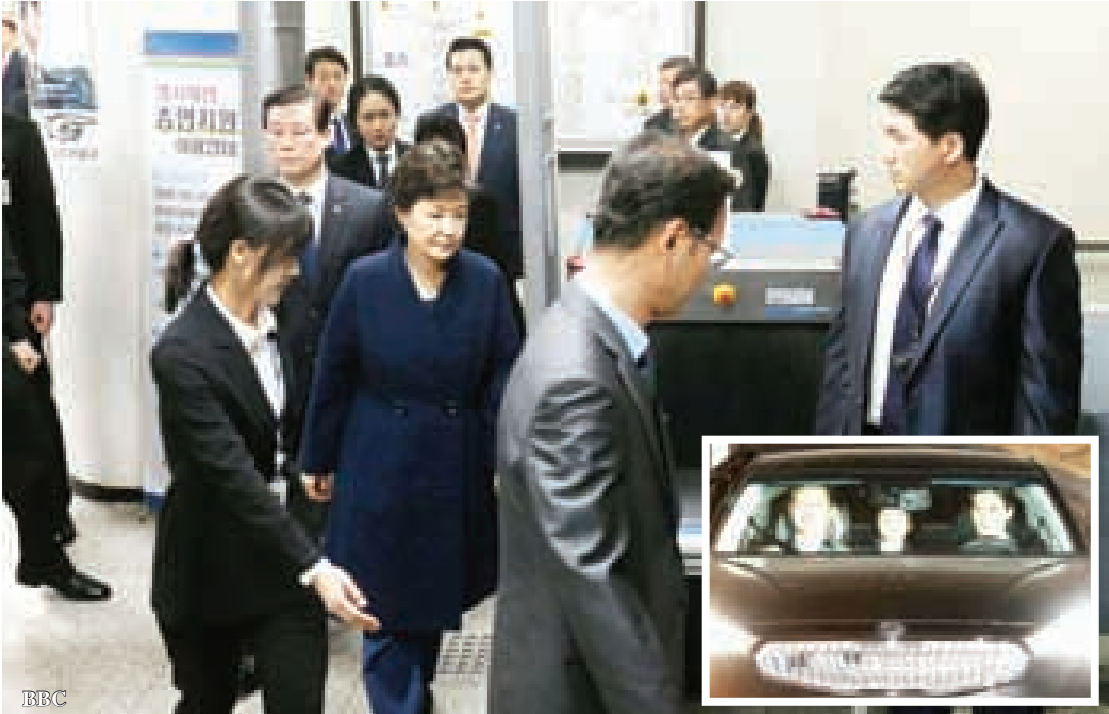
သမ္မတဟောင်းပတ်ဂွမ်ဟီးကို ဖမ်းဆီးခေါ်ဆောင်သွားစဉ်၊ ၎င်းသည် ဖြစ်မှုထင်ရှားပါက ထောင်ဒဏ် ၁၀ နှစ်ကျော် ချမှတ်ခံရဖွယ်ရှိသည်

ပါဘူး” ဟု အမေရိကန်နိုင်ငံခြားရေးဝန်ကြီး တိုင်လာဆန်ပါတကရောက်သည့် NATO နိုင်ငံခြားရေးဝန်ကြီးများ အစည်းအဝေးတွင် ဂျာမနီဝန်ကြီးက ပြောကြားသည်။ စစ်အသုံးစရိတ် တိုးမြှင့်မှုထက် စစ်အသုံးစရိတ်ကို မည်ကဲ့သို့ကောင်းမွန်စွာ အသုံးပြုရမည်မှာ ပိုအရေးကြီးကြောင်း နိုင်ငံများနှင့်ဒေသများ တည်ငြိမ်ရေး ပေးအပ်လျက်ရှိသည့်လူသားချင်းစာနာထောက်ထားမှု၊ ဖွံ့ဖြိုးတိုးတက်မှုနှင့် စီးပွားရေးအကူအညီများကိုပါ ထည့်သွင်းတွက်ချက်ရန် လိုအပ်ကြောင်း ဂျာမနီက ထောက်ပြထားသည်။ သို့သော်လည်း နေတိုးစစ်အုပ်စုဝင် နိုင်ငံများ၏ကာကွယ်ရေးအသုံးစရိတ် အသုံးပြုမှုပေါ် မူတည်ပြီး NATO အဖွဲ့ လုံခြုံရေးကို အမေရိကန်က အာမခံပေးမည်ဟု အမေရိကန်သမ္မတ ဒေါ်နယ်ထရမ်က အကြံပြုထားပြီး အဆိုပါ စစ်အုပ်စုသည် ခေတ်မီမီတော့သည့်အဖွဲ့ဖြစ်သည်ဟုလည်း ထရမ်က မှတ်ချက်ပြုထားသည်။ နေတိုးစစ်အုပ်စုတစ်ခုလုံး၏ ကာကွယ်ရေးအသုံးစရိတ် ၇၀ ရာခိုင်နှုန်းမှာ အမေရိကန်ပြည်ထောင်စုမှဖြစ်ပြီး နေတိုးအုပ်စုဝင် ဥရောပလေးနိုင်ငံဖြစ်သည့် အက်စတိုးနီးယား၊ ဂရိ၊ ပိုလန်နှင့် ဗြိတိန် နိုင်ငံတို့သာ ၂ ရာခိုင်နှုန်းသတ်မှတ်ချက်ကို ပြည့်မီသေးသည်။ ■ F-05