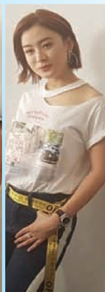
ဝတ်မှုရွှေရည်

ဧပြီလ ၁ ရက်နေ့က ရန်ကုန်မြို့ သမ္မတရုပ်ရှင်ရုံတွင် ပြုလုပ်ခဲ့သည့် ဂျိုး ဂျိုး ဂျက်ဂျက် ရုပ်ရှင်အထူးပွဲ