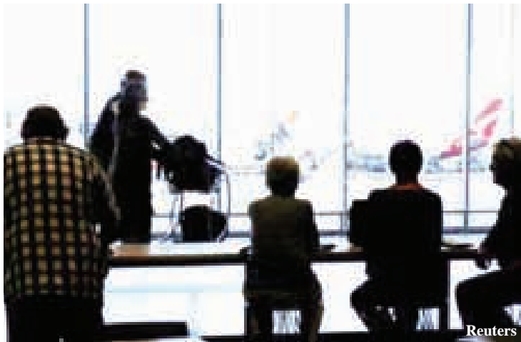
ဆွစ်ဇာန် အပြည်ပြည်ဆိုင်ရာ လေဆိပ်တွင် လေယာဉ်ပေါ်တက်ရန် စောင့်ဆိုင်းနေသည့်ခရီးသည်များ