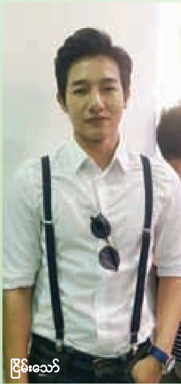
ဦးမိုးသော်