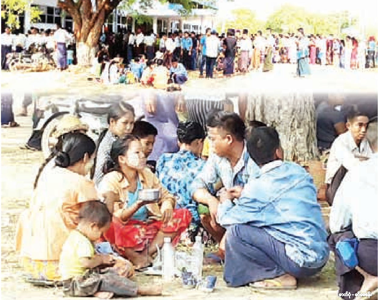
★ နိုင်ငံရေးပါတီ ၅ ခု ဝင်ရောက်ယှဉ်ပြိုင်သော မုံရွာပြည်သူ့လွှတ်တော် မဲဆန္ဒနယ်တွင် မဲပေးကြသူများ။