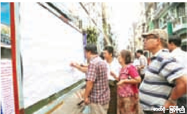
★ ရန်ကုန်တိုင်းဒေသ အမျိုးသားလွှတ်တော် မဲဆန္ဒအမှတ် ၆ တွင် မဲပေးရန် မဲစာရင်း ကြည့်နေသော လသာမြို့နယ်မှ ပြည်သူများ။