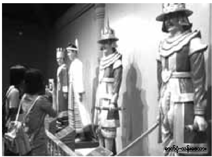
ယဉ်ကျေးမှုပြတိုက်အတွင်း လွတ်လပ်စွာ ဓာတ်ပုံရိုက်ကူးနေသူကို တွေ့ရစဉ်