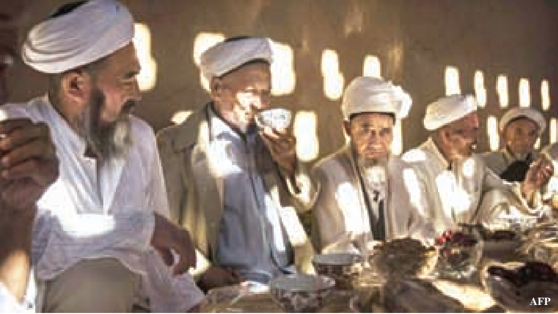
အူဂါမ္မတ်ဆလင်များက ၎င်းတို့သည် ရှင်ကျန်းမြို့တွင် ခွဲခြားဆက်ဆံမှုအမျိုးမျိုးနှင့်ရင်ဆိုင်နေရသည်ဟု ဆိုသည်