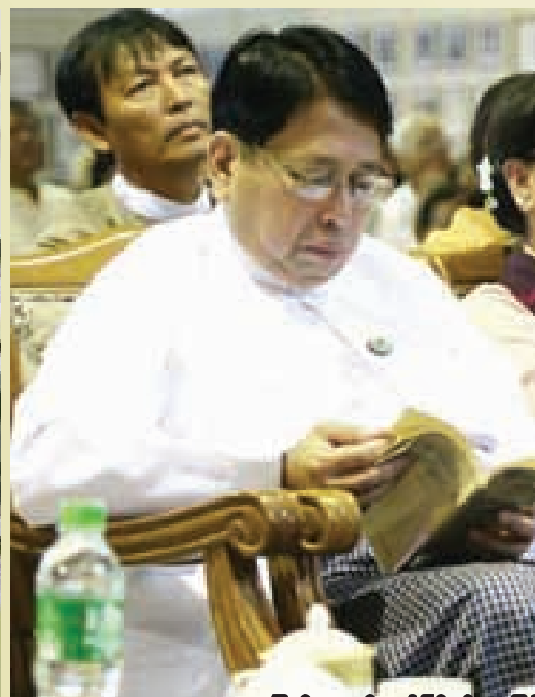
ပြည်ထောင်စုဝန်ကြီး ဦးဖေမြင့်

ဂျာနယ်ကျော် မမလေး ရာပြည့်အခမ်းအနားကို ဧပြီလ ၁ ရက်မှ ၃ ရက်နေ့အထိ ရန်ကုန်မြို့လမ်းမတော်မြို့နယ် သူနာပြုတက္ကသိုလ်ခန်းမတွင် ကျင်းပခဲ့စဉ်။