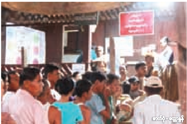
★ ဧပြီလ ၁ ရက်နေ့တွင် ချောင်းဆုံမြို့နယ် ကွန်ရိုက်ကျေးရွာ မဲရုံအမှတ် ၁ တွင် မဲပေးပိုင်ခွင့်ရှိသူ ၄၂၀၀ ကျော်ရှိပြီး ချောင်းဆုံမြို့နယ် မဲရုံ ၆၂ ရုံအနက် ဆန္ဒမဲပေးခွင့်ရှိသူအများဆုံး မဲရုံဖြစ်သည်။