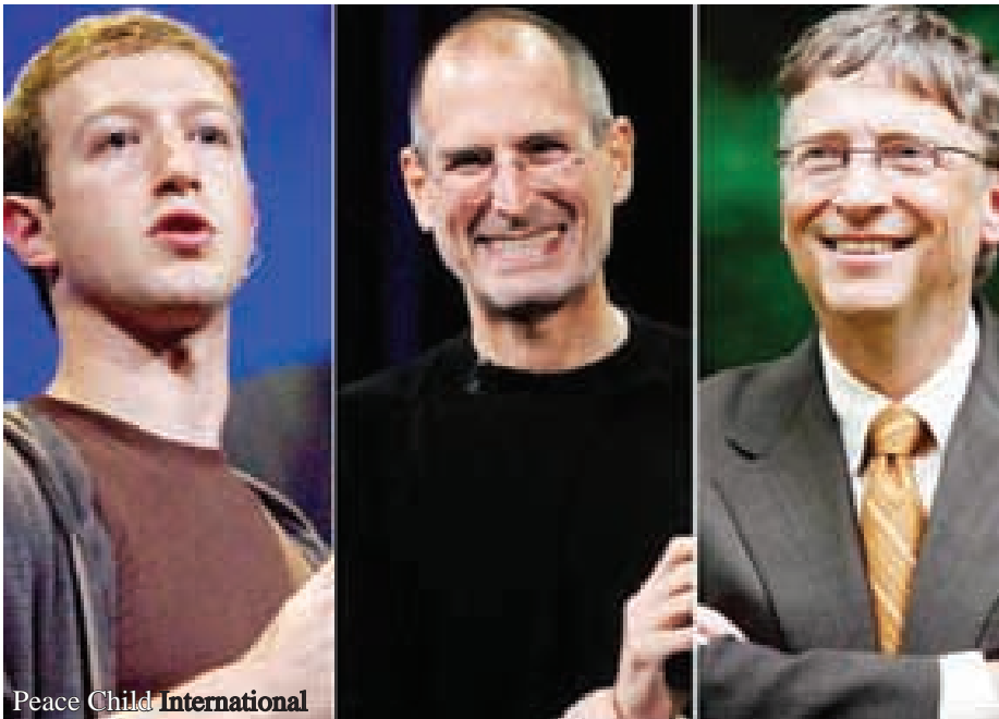
Peace Child International

ဒုတိယနှစ်ရောက်သည်အထိ ကျောင်းကသင်နေသော ပညာရပ်များထက် ကျောင်းတွင်ထားပေးထားသော ကွန်ပျူတာများတွင် အချိန်ကုန်နေသည်ကများသည်။ ပေါလ် အယ်လန်ဆိုသူနှင့်တွေ့ပြီး ကွန်ပျူတာနှင့် ဆော့ဖ်ဝဲတီထွင်ခြင်းကို ရူးသွပ်စွာလုပ်ဆောင်တော့သည်။ သူ့အနေအထားက ကောလိပ်တွင် ဆက်တက်နေပါက သူဝါသနာပါသည့် ကွန်ပျူတာပညာကို ကောင်းစွာ မလုပ်ဆောင်နိုင်ဟု မြင်လာသည်။ ထို့ကြောင့် ဒုတိယနှစ်အရောက်မှာပင် ကျောင်းထွက်ပြီး သူ့ကိုယ်ပိုင်ကုမ္ပဏီထူထောင်ကာ ဆော့ဖ်ဝဲတီထွင်မှုကို စလုပ်သည်။ ထိုစဉ်က ကျောင်းထွက်ခဲ့ရခြင်းနှင့် ပတ်သက်