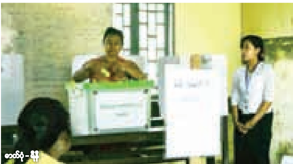
★ လှိုင်သာယာမြို့နယ် အမှတ် ၁၉ ရပ်ကွက် အ.မ.က ၃၇ မသန်စွမ်းသူတစ်ဦး လာရောက်မဲပေးစဉ်။