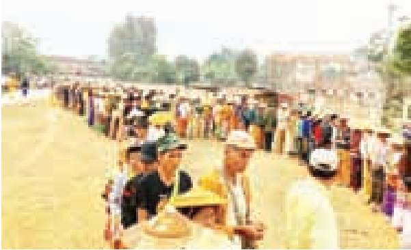
★ မဲရုံရွှေပြောင်းခြင်းခံရတဲ့ မော်မေကျေးရွာအုပ်စု၊ မိုင်းအွတ်ကျေးရွာအုပ်စု၊ ကွန်ကျောင်းကျေးရွာအုပ်စု၊ နောင်အက်ကျေးရွာအုပ်စုက ပြည်သူတွေ မိုင်းရှူးမြို့ မဲရုံမှာ မဲပေးဖို့ စောင့်နေကြပါတယ်။