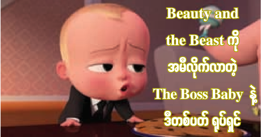
Beauty and the Beast ကို အမိလိုက်လာတဲ့ The Boss Baby နဲ့ ဒီတစ်ပတ် ရုပ်ရှင်

ကြာသပတေးညအကြိပ်သမ္မုမှာ စကားလက် ဂျိုဟန်ဆင် သရုပ်ဆောင်ထားတဲ့ Ghost in the Shellဇာတ်ကားက ဝင်ငွေ အမေရိကန်ဒေါ်လာ ၁ ဒသမ ၈ သန်းနဲ့ ဦးဆောင်ခဲ့ပေမယ့် သောကြာနေ့ မှာတော့ The Boss Baby အန်နီမေးရှင်းက ပြန်ဦးဆောင်ခဲ့ပြီး သုံးပတ်ဆက် အောင်ပွဲခံနေတဲ့ Beauty and the Beast ကို အမိလိုက်လာ ခဲ့ပါတယ်။