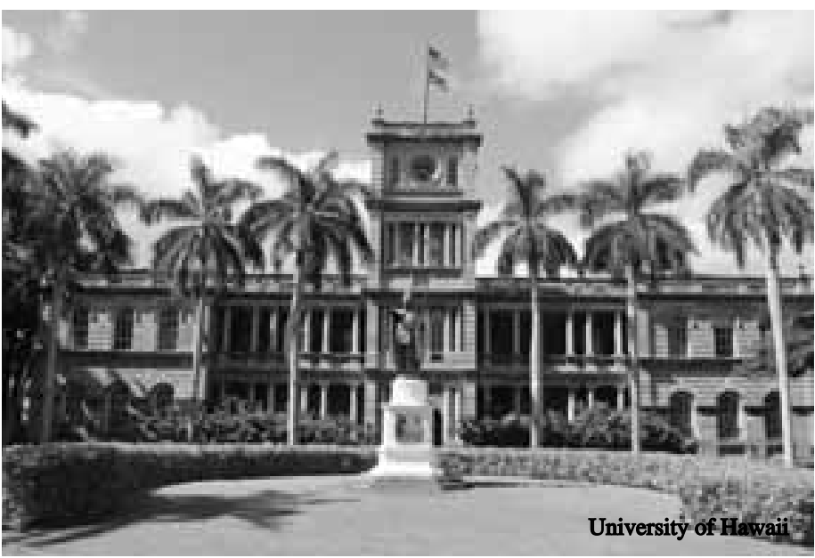
University of Hawaii

East-West Center မှ ပညာသင်ဆုပေးအပ် ချီးမြှင့်မည့် အစီအစဉ်ဖြစ်ပါသည်။ အထောက်အပံ့အနေနှင့် Non-Profit Organization/Agency/Association များကို ပေးအပ်မည့် ပညာသင်ဆုဖြစ်သည်။ Asia Development Bank အနေနှင့် အဖွဲ့ဝင်နိုင်ငံများမှ နိုင်ငံသားများအား စီးပွားရေးပညာ၊ စီမံအုပ်ချုပ်ရေး ပညာ၊ သိပ္ပံနှင့် နည်းပညာများအပြင် အခြားနိုင်ငံ ဖွံ့ဖြိုးတိုးတက်စေမည့် ပညာရပ်များကို လေ့လာသင်ယူနိုင်ရန် စီစဉ်ပေးသော ပညာသင်ဆုအစီအစဉ်တစ်ခုလည်းဖြစ်ပါသည်။ ပညာသင်ဆုရရှိပြီး သက်ဆိုင်ရာပညာရပ်များကို လေ့လာဆည်းပူးကာ ဘွဲ့ရပြီးပါက မိမိတို့နိုင်ငံများသို့ပြန်ကာ စီးပွားရေးနှင့် လူမှုရေးလုပ်ငန်းများ ဖွံ့ဖြိုးတိုးတက်ရန် ဆောင်ရွက်ကြရမည်ဖြစ်သည်။ East-West Center မှာ အုပ်ချုပ်သူများနှင့် ဟိုနိုလူလူရှိ Asia Development Bank-Japan Scholarship Program အဖွဲ့သည် သက်ဆိုင်ရာ ပြဋ္ဌာန်းဘာသာရပ်များကို မာနီအာမြူနီ University of Hawaii တွင် ပညာသင်ယူခွင့်ရရန် စီစဉ်ဆောင်ရွက်ပေးမည်ဖြစ်သည်။ ယင်းတက္ကသိုလ်တွင် ပညာသင်ဆုရရှိသူများအား ပညာရေး၊ ခေါင်းဆောင်မှု ဖွံ့ဖြိုးရေးနှင့် ယဉ်ကျေးမှုလုပ်ငန်းများကို ပူးပေါင်းဆောင်ရွက်စေရန်လည်း စီစဉ်ထားကြောင်း သိရသည်။ ထို့ပြင် LL.M. (Law) ဘွဲ့ကိုလည်း ပေးအပ်ရန် စီစဉ်ထားကြောင်း သိရသည်။ ပညာသင်ကြားရမည့် နေရာမှာ ဟိုနိုလူလူကျွန်း၊ University of Hawaii ဖြစ်ပါသည်။