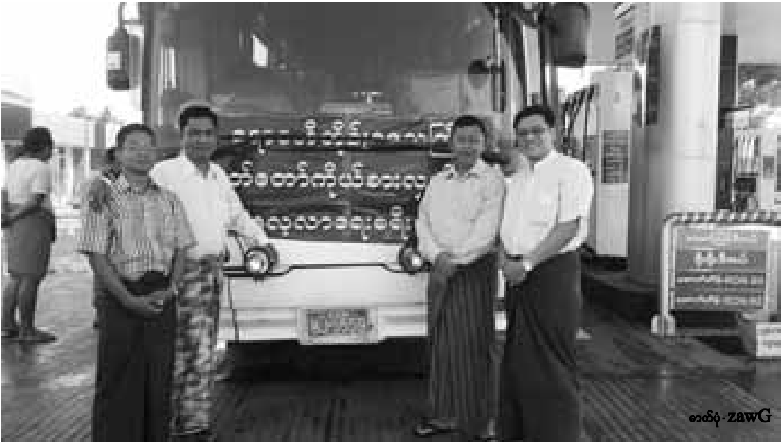
ဧရာဝတီတိုင်းဒေသကြီး လွှတ်တော်ကိုယ်စားလှယ်များ ရှမ်းပြည်နယ် လွှတ်တော်သို့ သွားရောက်လေ့လာစဉ်