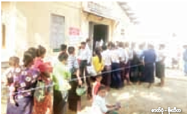
★ ရခိုင်ပြည်နယ် အမ်းမြို့နယ် ပြည်သူ့လွှတ်တော်နေရာအတွက် မဲဆန္ဒရှင်များ၏ မဲပေးမှုမြင်ကွင်းများ။