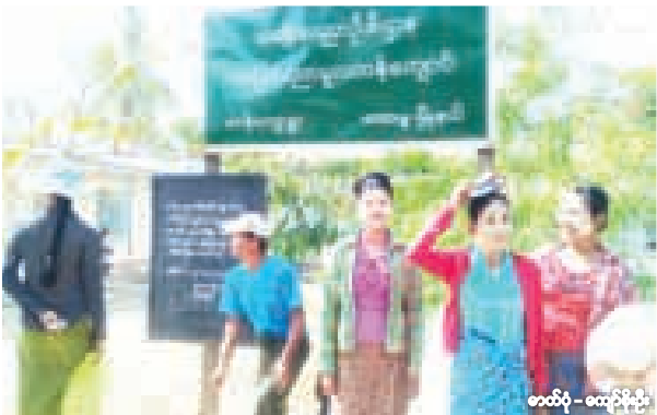
★ ကော့မှူးမြို့နယ် မဝန်းကျေးရွာမြင်ကွင်း။