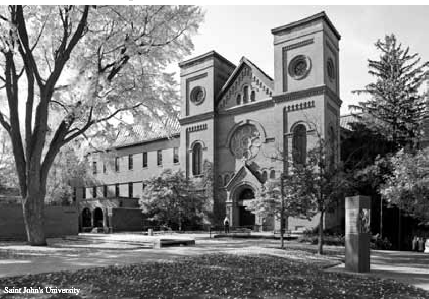
Saint John's University

College of Saint Benedict/Saint John's University – Minnesota အဖွဲ့က ပေးအပ်မည့် ပညာသင်ဆုဖြစ်သည်။ နိုင်ငံတကာမှ ကျောင်းသားကျောင်းသားများအတွက် ပေးအပ်သည့် ပညာသင်ဆုလည်းဖြစ်သည်။ ပညာသင်ဆုရရှိသူများသည် နွေရာသီမေ ဇွန်၊ ဇူလိုင်၊ ဩဂုတ်လများတွင် အချိန်ပြည့် ကျောင်းတွင်း၌ အလုပ်လုပ်ခွင့်လည်း ရရှိမည်ဖြစ်သည်။ Collegeville မြို့ရှိ College of Saint Benedict/Saint John's University တို့တွင် တက်ရောက် ပညာသင်ကြားရမည်ဖြစ်ပြီး ပေးအပ်မည့် ဘွဲ့အမျိုးအစားမှာ Undergraduate အနေနှင့် တက်ကာ သက်ဆိုင်ရာ ဘာသာရပ်များတွင် သတ်မှတ်ထားသည့်အတိုင်း သင်ယူပြီးမှ ဘွဲ့တစ်ခုခု ရရှိမည်ဖြစ်သည်။ ပညာသင်ဆုအဖြစ် ထောက်ပံ့ကြေး ခေါ်လာ ၁၂,၀၀၀ မှ ၂၅,၀၀၀ အထိရှိနိုင်ပါသည်။ ခေါ်ယူမည့် အရေအတွက်မှာ ၁၁၀ ခန့်ဖြစ်သည်။ ပညာသင်စရိတ် ကျူရှင်ကြေး၊ အခန်းခ၊ စားသောက်စရိတ် ထောက်ပံ့ကြေးများ ရရှိမည်။ ဘွဲ့ရသည့်အထိ လေးနှစ်တက်ရောက်ရမည်ဖြစ်သည်။ မေလတွင် နောက်ဆုံးထားပြီး လျှောက်ထားရန် သတ်မှတ်ထားသည်။ လျှောက်ထားသူများသည် - - TOEFL အမှတ် 80 iBT, 6.5 ELTS, SAT 1500 နှင့် GPA 3.0 (on 4.0 scale) ရရှိထားသူများဖြစ်ရမည်။ - လျှောက်လွှာနှင့်အတူ Essay တစ်ပုဒ်ကို သတ်မှတ်ထားသည့်အတိုင်း ပူးတွဲလျှောက်ထားရမည်။ - ဘုတ်အဖွဲ့က သတ်မှတ်ထားသည့် လျှောက်လွှာပုံစံဖြင့်သာ လျှောက်ထားရန်လိုပါသည်။