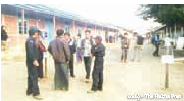
★ ချင်းပြည်နယ် ထန်တလန်မြို့မဲဆန္ဒနယ် အမှတ် ၃ အမျိုးသားလွှတ်တော်နေရာအတွက် ထန်တလန်မြို့တွင် မဲပေးကြစဉ်။