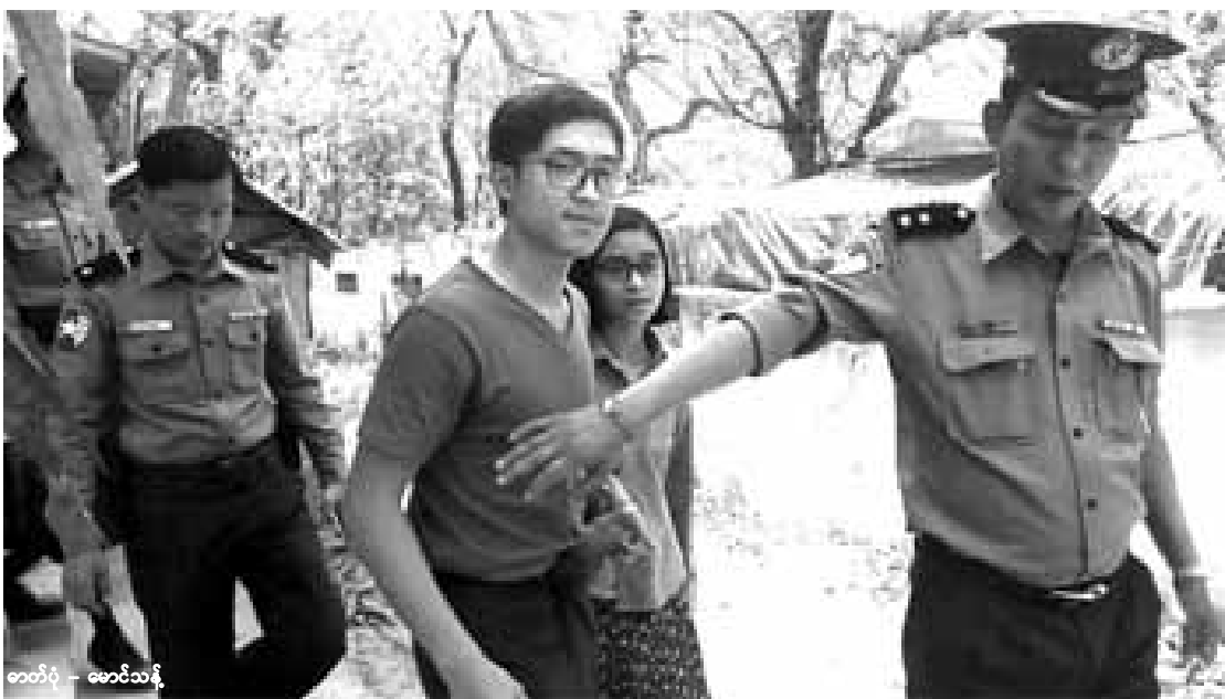
အိမ်အကူအမျိုးသမီးကို ရိုက်နှက်ခဲ့သည်ဟု တရားစွဲဆိုခံရသည့် အိမ်ရှင်လင်မယားကို မတ်လ ၁၇ ရက်နေ့က အမရပူရမြို့နယ်တရားရုံးတွင် ရုံးတင်စစ်ဆေးပြီးနောက်တွေ့ရစဉ်

အမရပူရမြို့နယ်အတွင်းရှိ စက်ချုပ်ဆိုင်တစ်ခုတွင် အိမ်အကူလုပ်ကိုင်နေသည့် ပအိုဝ်းအမျိုးသမီးငယ်ကို ရိုက်နှက်ခဲ့သည်ဟု တရားစွဲဆိုခံရသော အိမ်ရှင်လင်မယားကို မဖွယ်မရာပြုမှု ရာဇသတ်ကြီးပုဒ်မ ၃၅၄ ဖြင့် မတ်လ ၃၀ ရက်နေ့က ထပ်မံတရားစွဲထားကြောင်း ယင်းမြို့နယ်ရဲစခန်းထံမှ သိရသည်။ “အရင်စွဲဆိုထားတဲ့အမှုတွေအပြင် ဥပဒေအကြံပေးတင်လိုက်တဲ့အခါ အင်္ကျီချွတ်ပြခိုင်းတာတွေ လုပ်တဲ့အတွက် မဖွယ်မရာ ပြုလုပ်မှုထပ်တိုးပြီး တရားစွဲတင်ပါတယ်” ဟု ယင်းရဲစခန်းမှ တာဝန်ကျအရာရှိတစ်ဦးက ပြောကြားသည်။