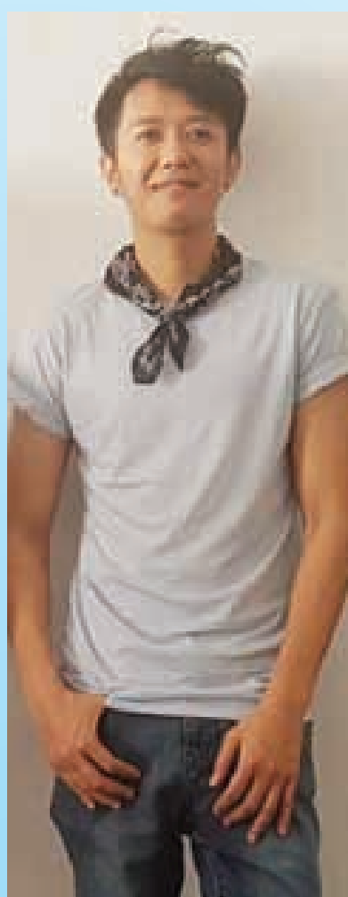
စိုင်းစိုင်းခမ်းလှိုင်

မတ်လ ၂၆ ရက်နေ့က ရန်ကုန်မြို့ စမ်းချောင်းမြို့နယ် ကျွန်းတောလမ်းရှိ Eliza Beauty Spa ဖွင့်ပွဲ