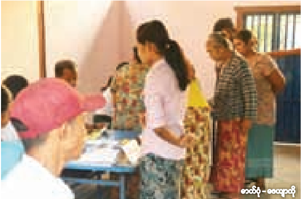
★ ပဲခူးတိုင်းဒေသကြီး အမျိုးသားလွှတ်တော် မဲဆန္ဒနယ်အမှတ် ၄ အတွက် ကျောက်တံခါးမြို့နယ် ဈေးပိုင်းရပ်ကွက် မဲရုံတွင် ယနေ့နံနက် ၁၀ နာရီခန့်က မဲပေးရန် ပြင်ဆင်နေသူများ။