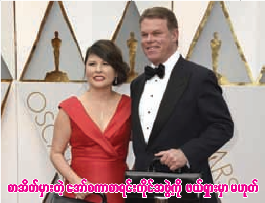
စာအိတ်မှားတဲ့ အော်စကာစာရင်းကိုင်အဖွဲ့ကို ဖယ်ရှားမှာ ပဟုတ်

အော်စကာဆုစာအိတ်များကို ထည့်ထားသည့် လက်ဆွဲအိတ်များကိုင်ရသော PwC စာရင်းကိုင်အဖွဲ့သားနှစ်ဦး ဖြစ်ပေမယ့် မလိုအပ်ဘဲ မှားယွင်းအောင် လုပ်သလို ဖြစ်စေခဲ့ပါတယ်။ ရုပ်ရှင်ဝိဇ္ဇာသိပ္ပံ အကယ်ဒမီကတော့ သူတို့နဲ့ ရ ၃ နှစ်ကြာ လက်တွဲလာတဲ့ Pricewaterhouse Coopers(PwC) စာရင်းကိုင်အဖွဲ့နဲ့ လက်တွဲဖြတ် မှာ မဟုတ်ဘူးလို့ စစ်ဆေးမှုတွေ အပြီးမှာ ကြေညာခဲ့တာ ဖြစ်ပါတယ်။ ဒါပေမဲ့ နောက်လာမယ့် ဆုပေးပွဲတွေမှာ အော်စကာဆုစာအိတ်တွေ ထည့်ထားတဲ့ အိတ် နှစ်အိတ်ကို ကိုင်တဲ့ သူနှစ်ယောက်အပြင် နောက် တစ်ဦးပါ ထပ်စောင့်ပေးရမယ်လို့ ဆိုပါတယ်။ အဲဒီလူတွေဟာ ဇာတ်ခုံနောက်မှာ တွစ်တာ လူမှု ကွန်ရက်သုံးတာ၊ ဓာတ်ပုံတွေ၊ စာတွေ လူမှု ကွန်ရက်ပေါ်တင်တာတွေ မလုပ်ရဘူးလို့ပါ ပိတ်ပင် ထားပါတယ်။ လက်ဆွဲအိတ် နှစ်အိတ်နဲ့ စာအိတ်နှစ်စုံစီကို လူနှစ်ယောက်က ကိုင်ထားပြီး ကြေညာမယ့်သူ လက်ထဲ ထည့်ပေးတဲ့ အစီအစဉ်ဟာ ဆုကြေညာ မယ့်သူ စင်မြင့်ဘယ်ဘက်က တက်တက်၊ ညာဘက် က တက်တက် အဆင်ပြေအောင် လုပ်ပေးထားတာ