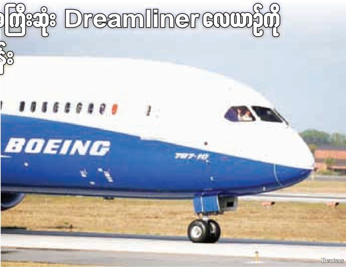
မျှော်လင့်ထားသည့်အတိုင်း တိကျစွာ စွမ်းဆောင်ပျံသန်းနိုင်ခဲ့သည်ဟု လေယာဉ်မှူးများက ပြောကြားသည်

မီနီယံကိုယ်ထည်ဖြင့် တည်ဆောက်ထားကာ ဆီစားသက်သာသည့်အင်ဂျင်တပ်ဆင်ထားသော ၎င်း၏ A330 neo လေယာဉ်ဖြင့် ဘိုးအင်း 787-10 ကို ယှဉ်ပြိုင်မည်ဖြစ်သည်။