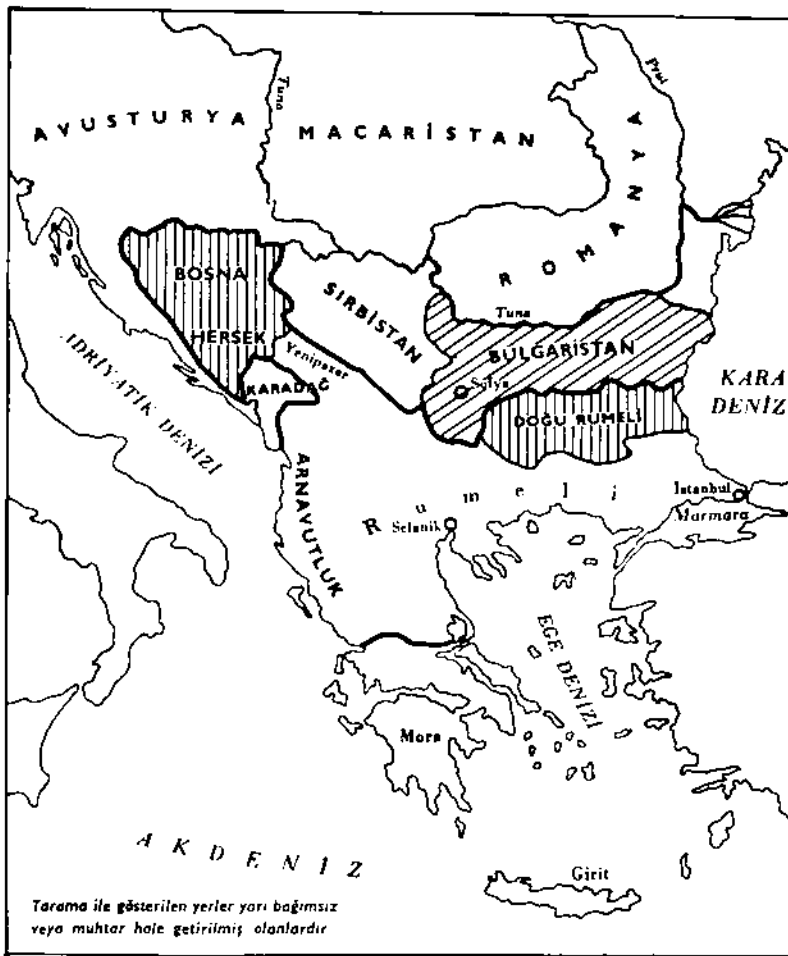
Berlin Antlaşmasına göre Avrupa'da Osmanlı toprakları.