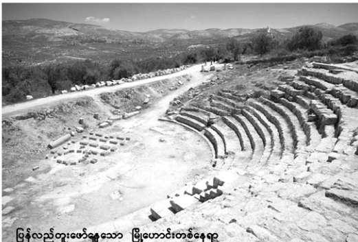
မြန်လည်တူးဖော်နေသော မြို့ဟောင်းတစ်ခု

ရောက်ရောက်လာသောဖျူကမ်းသက် တို့နှင့် မသက်တင့်သော မှန်မာများမှာ လည်း သမ္မူ၊ ပဲခူး၊ ပုသိမ်သည့်ယခင်