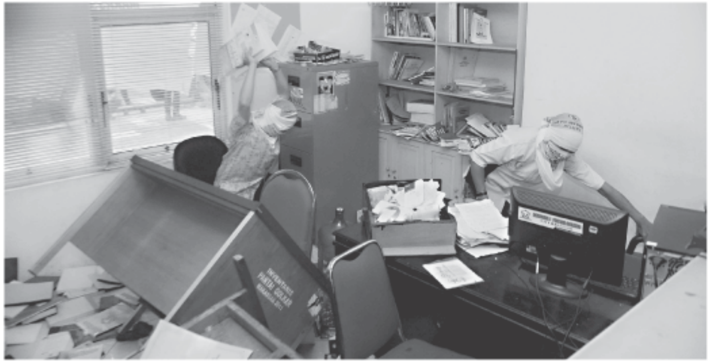
SEJUMLAH simpatisan Golkar merusak fasilitas kantor Golkar Makassar, Sulsel, Minggu (12/10). Mereka memprotes atas reshuffle 198 anggota dan 50 pengurus harian DPD Kota Makassar melalui rapat pleno tanpa evaluasi kinerja kepemimpinan.

"Ada tiga pasal kunci yang dapat memperkuat pembatasan di paripurna malam nanti, dan 99 persen berpotensi adanya vacuum of power yakni pasal 14, pasal 15 ayat 1 dan 2, serta pasal 34 ayat 4, 5, 6, 7 dalam Undang-undang no 17 tentang MD3 yang multitafsir," tandasnya. (tribunnews.com)