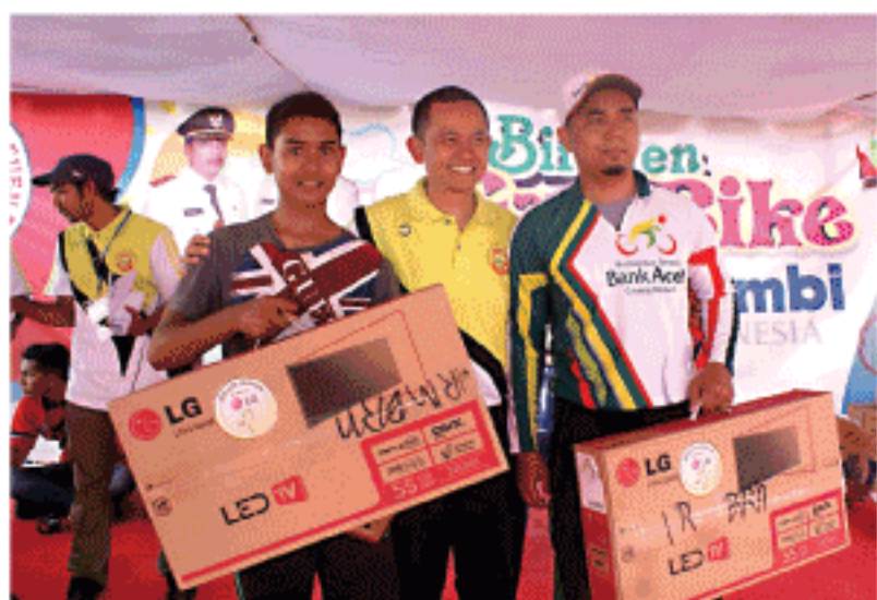
DANYONIF 113/Jaya Sakti Bireuen, berfoto bersama peserta Bireuen Fun Bike yang meraih hadiah TV LCD LG.