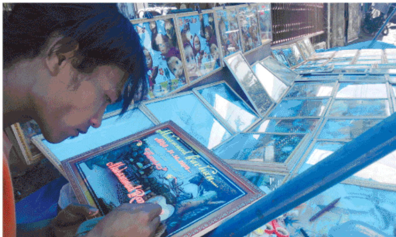
PEDAGANG asal Padang mengukir tulisan pada gambar hiasan yang dijual di kompleks Lapangan T Umar, Meulaboh, Aceh Barat dengan harga Rp 50 ribu, Minggu (12/10).

Atas kondisi itu, Pemkab Aceh Jaya pun telah menyalurkan bantuan 8 ton beras kepada 2.242 Kepala Keluarga (KK) yang menjadi korban banjir di empat kecamatan tersebut. (e45)