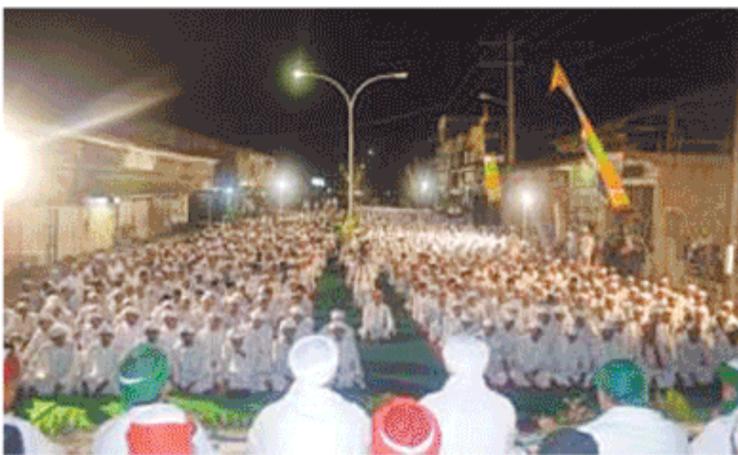
RIBUAN warga Kota Fajar, Kecamatan Kluit Utara, Aceh Selatan, Sabtu (11/10) larut dalam zikir akbar, shalawat nabi, dan taustiyah agama yang diselenggarakan oleh Majelis Zikrullah Aceh Nurussaladah Kluit Utara yang dipusatkan di halaman Masjid Baiturrahim, Kuta Fajar.

Halaman Masjid Baiturrahim, Kuta Fajar pun tampak sesak dari jamaah berpakaian serba putih yang mengikuti acara dimaksud. (tz)