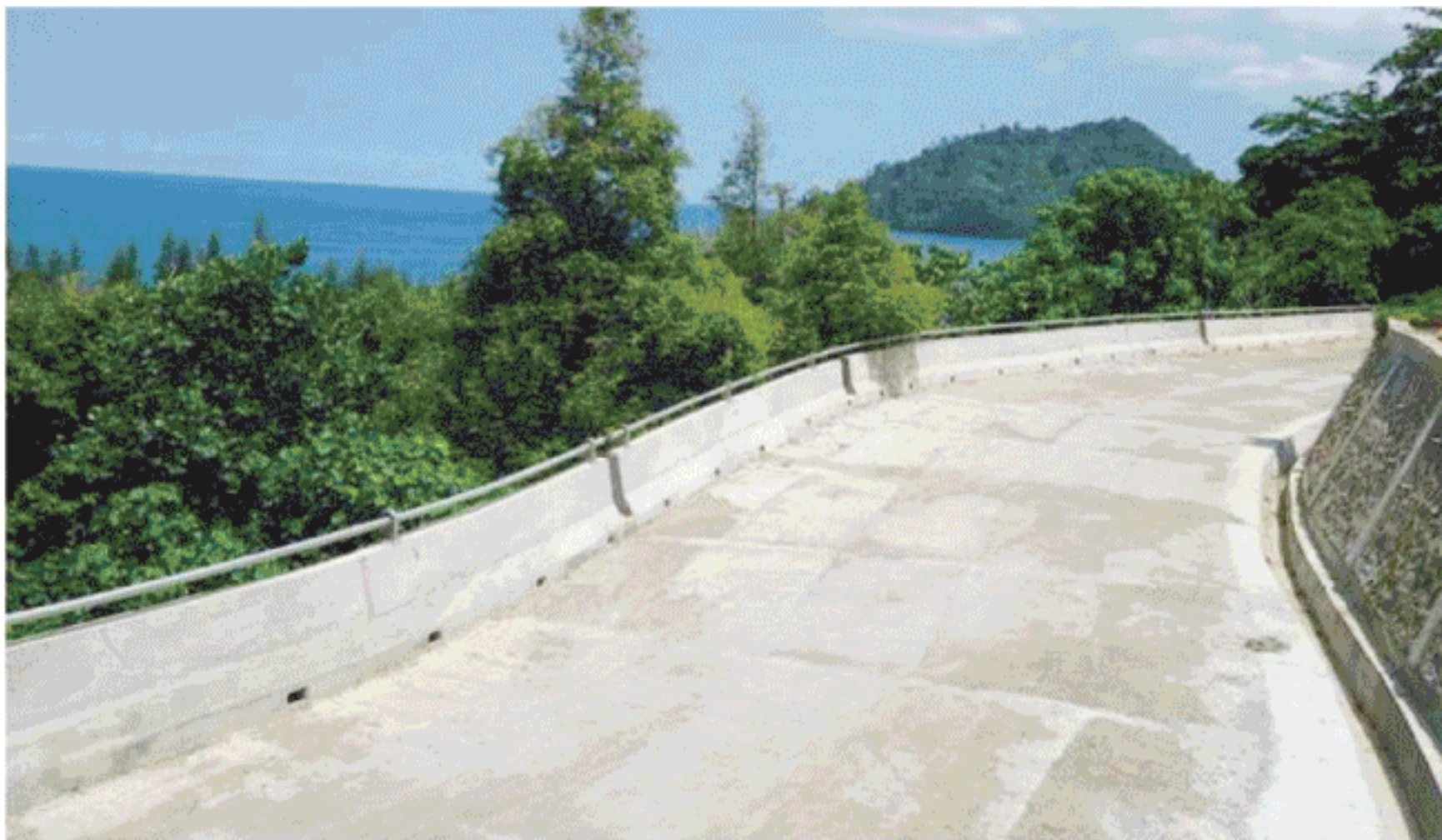
SALAH satu ruas jalan kantilever 'menggantung' kokoh di tebing bukit yang menghadap Samudera Hindia pada jalur antara Tapaktuan-Kotafajar.