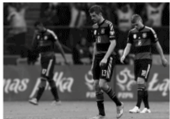
GAGAL - Thomas Müller (tengah) memimpin rekan-rekannya untuk meninggalkan lapangan usai ditekuk Polandia, dengan skor 0-2, dini hari kemarin.