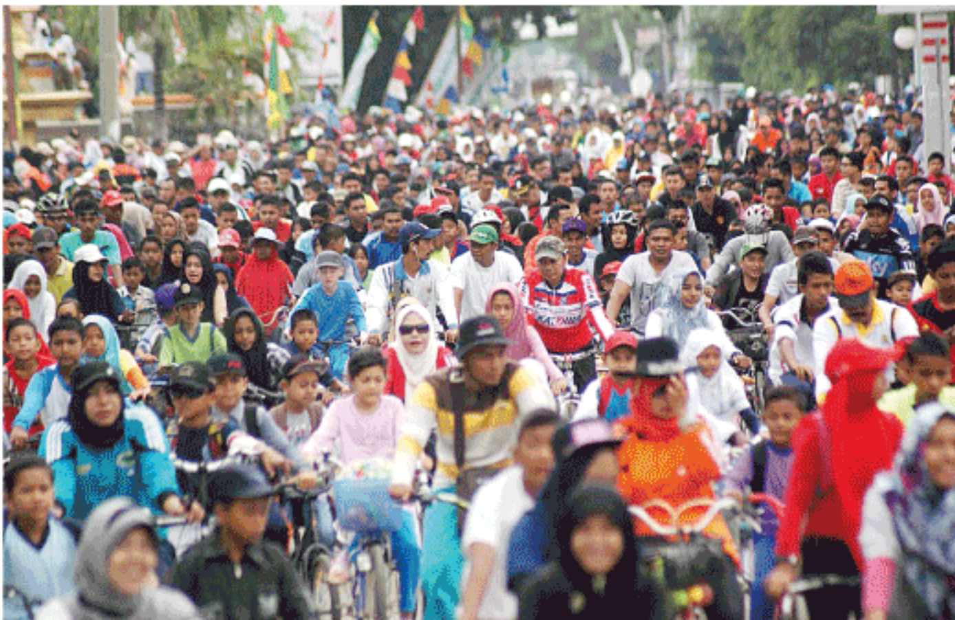
RIBUAN peserta Bireuen Fun Bike memadati ruas jalan protokol, Minggu (12/10). Fun Bike yang diikuti sekitar 7.000 peserta tersebut dalam rangka memeriahkan HUT ke-15 Bireuen.