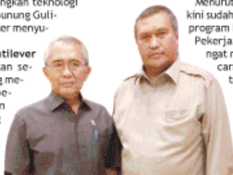
MENTERI PU, Djoko Kimanto bersama Bupati Aceh Selatan, HT Sama Indra dalam satu pertemuan di Medan belum lama ini.

Teknologi dengan konstruksi kantilever itu bukan hanya memperlebar badan jalan tetapi sekaligus menjadikan jalan tersebut tak ubahnya 'balkon' yang menggantung di tebing batu yang dari 'balkon' itu pula para pelintas bisa menikmati keindahan alam anugerah Tuhan yang membentang di bawahnya. Singkat kata, jalan kantilever yang dibangun di Aceh Selatan selain untuk kelancaran transportasi sekaligus menghadirkan pesona lain untuk mendukung sektor pariwisata.