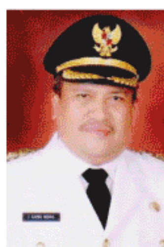
HT Sama Indra, SH

Menurut Bupati Sama Indra, pihaknya akan melengkapi berbagai fasilitas termasuk fasilitas wisata kuliner di jalur bawah yaitu jalur alternatif. "Jalur alternatif itu sudah diusulkan peningkatan dengan sumber dana alokasi khusus (DAK) 2015 sepanjang tiga kilometer," kata Bupati HT Sama Indra. Dan beberapa waktu lalu, Bupati Sama Indra sudah bertemu langsung dengan Menteri PU pada suatu kegiatan di Medan. "Pak Menteri sudah meminta untuk dijadwalkan peresmian jalan kantilever Aceh Selatan dalam waktu dekat ini," demikian Bupati Aceh Selatan. (adv)