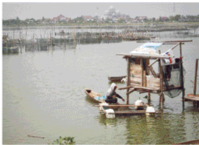
Jaring tempat bibit ikan milik nelayan kecil di kawasan Waduk, Lhokseumawe, bertambah banyak, Minggu (12/10). Waduk ini yang seharusnya difungsikan untuk penanggulangan banjir menjadi kawasan tempat mencari ikan.