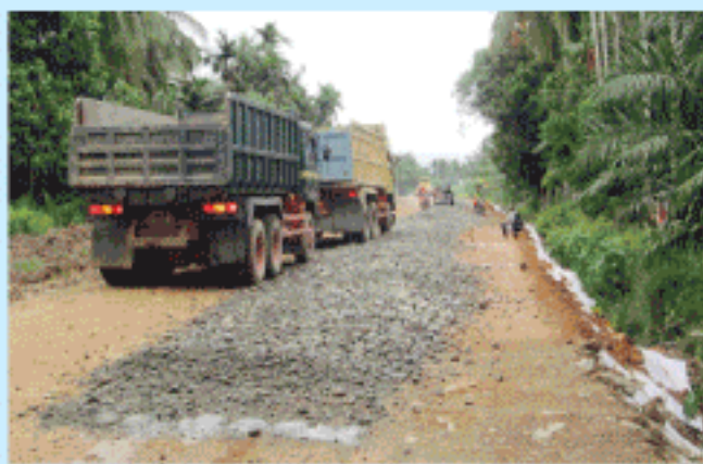
RUAS jalan Bulohseuma sedang dipacu terus pembangunannya untuk membuka keterisoliran.

Apresiasi kepada Bupati dan Wakil Bupati Aceh Selatan atas upaya