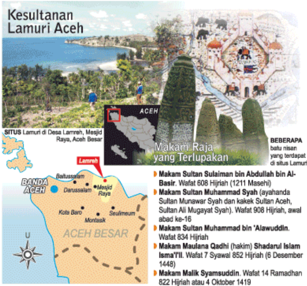
GRAVIS: SERAMBI/ENDRA, JL.

PEMERINTAH Aceh dan kabupaten/kota hampir selalu berkoar-koar bahwa Tanah Rencong ini punya sejarah hebat dengan tokoh-tokoh pelaku sejarah yang legendaris. Aceh tempo doeloe juga dikaitkan sebagai satu dari beberapa kerajaan Islam kuat di dunia. Sayangnya, di lapangan, nyaris tak ada upaya penyelamatan situs-situs budaya bernilai sejarah itu. Fenomena ini seakan menyiratkan bahwa tak ada bukti pengakuan dari generasi saat ini terhadap kegemilangan sejarah masa silam. Apakah pemerintah tidak tahu atau tidak mau tahu? Serambi mengulasnya dalam laporan eksklusif berikut ini.