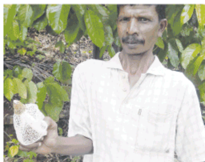
SEORANG warga Kecamatan Pidie, Kabupaten Pidie, Minggu (12/10/2014) memperlihatkan jamur berbentuk topi rajut haji yang ditemukan di semak-semak batang melinjo.