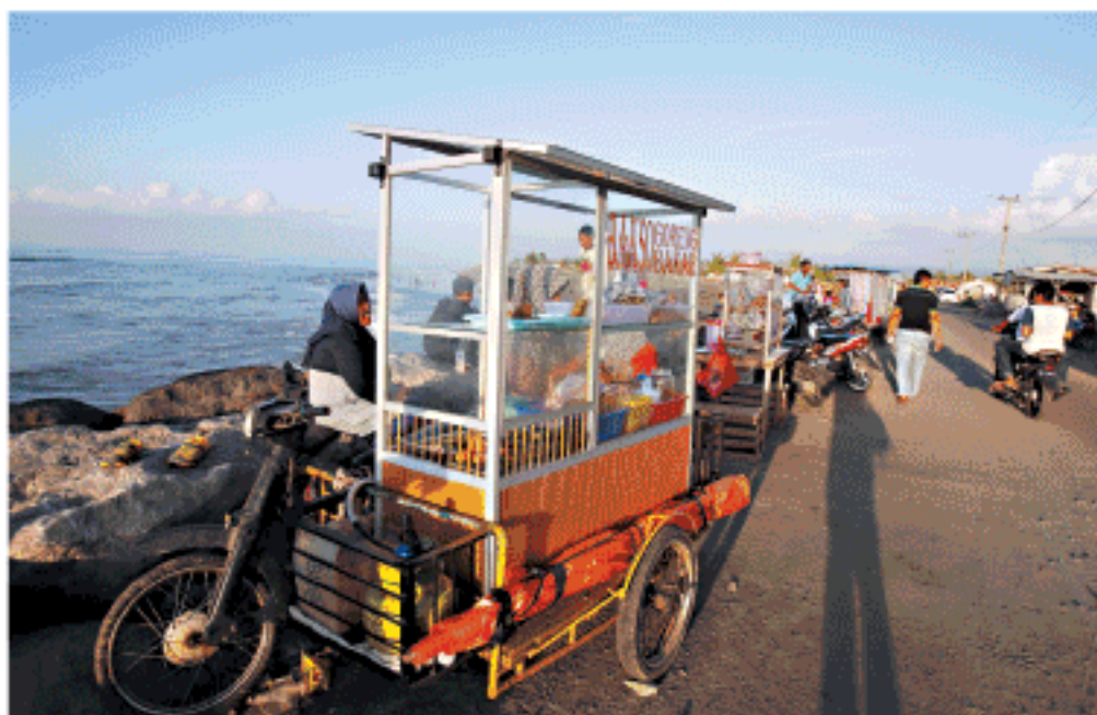
BERWISATA DI PANTAI SYIAH KUALA