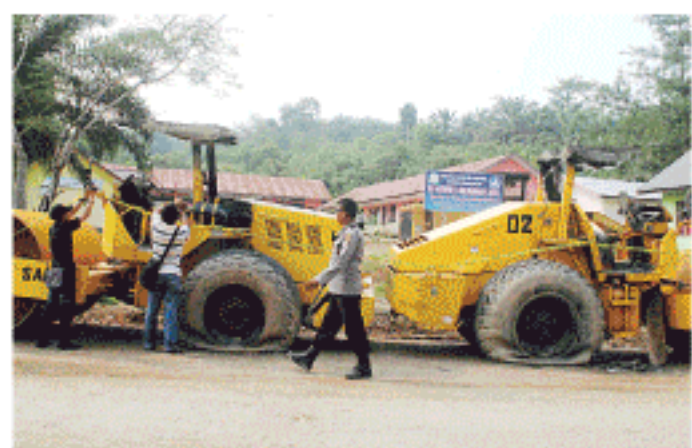
DUA unit alat berat jenis compack, milik PT Agra Wisesa yang dibakar oleh orang tak dikenal di Dusun Alur Canang, Desa Seumanah Jaya, Kecamatan Ranto Peureulak, Aceh Timur, Minggu (12/10).