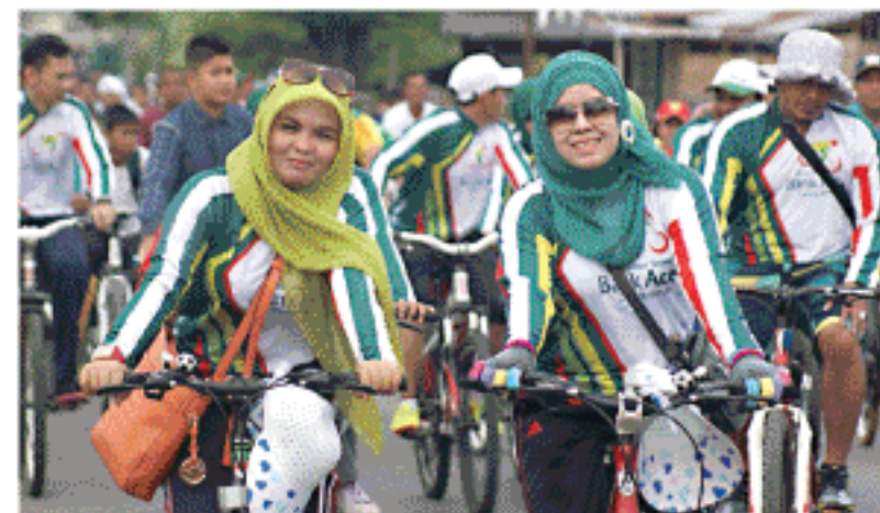
PESERTA mengikuti Bireuen Fun Bike dalam rangka memeriahkan HUT ke-15 Bireuen, Minggu (12/10).