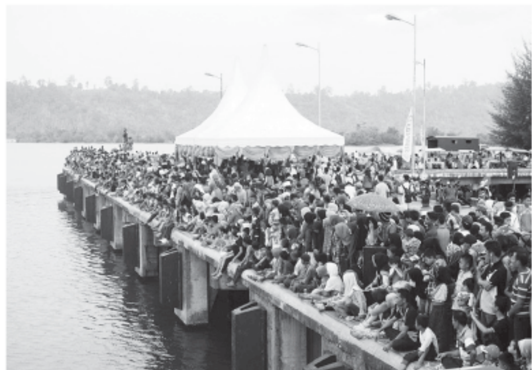
RATUSAN masyarakat Sinabang, Kabupaten Simeulue, memadati dermaga pelabuhan kargo untuk menyaksikan lomba perahu tradisional dan renang masal, menyambut hari jadi Simeulue ke 15, Minggu (12/10).