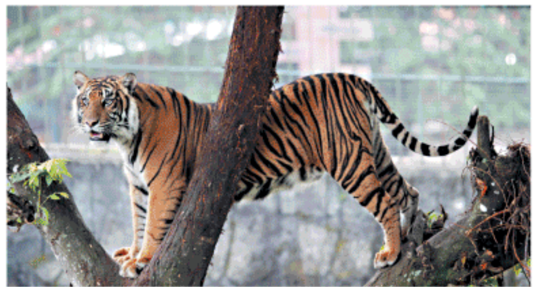
SEEKOR Harimau (Sumatera Panthera tigris sumatrae) bermain di atas pohon di Taman Margasatwa dan Budaya Kinantan Bukittinggi, Sumbang, Sabtu (11/10). Taman Margasatwa dan Budaya Kinantan Bukittinggi, saat ini telah mengoleksi sebanyak enam ekor harimau Sumatera dua diantaranya baru berumur 19 hari.

Panjang keseluruhan transmisi HVDC ISJ 742 km yang meliputi transmisi DC (Direct Current) sepanjang 464 km dan transmisi AC (Alternating Current) 278 km. Pembangunan Transmisi HVDC ISJ melewati 4 provinsi, yaitu Sumatera Selatan, Lampung, Banten, dan Jawa Barat. Pembangunan Transmisi HVDC ISJ memerlukan lahan seluas 300 hektare (ha). (okezone)