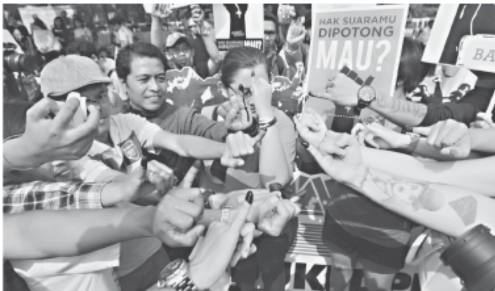
AKTIVIS dari Kontra melakukan aksi menolak pilkada tak langsung di Bundaran Hotel Indonesia, Jakarta, Minggu (12/10). Selain melakukan orasi menolak pilkada langsung, mereka juga mengumpulkan tanda tangan dan KTP masyarakat yang juga menolak pemilihan pemimpin daerah melalui DPRD.

Dengan terpilihnya Jokowi-JK sebagai pasangan presiden mendatang, Bibit berharap agar pemerintahan ini dapat lebih masih melakukan upaya tidak hanya pemberantasan, melainkan juga soal pencegahan korupsi. "Sia-papun presidennya silakan. Asal kan berani memberantas korupsi, kita dukung sepenuhnya, dan masyarakat kita ajak," imbu-hnya. (tribunnews.com)