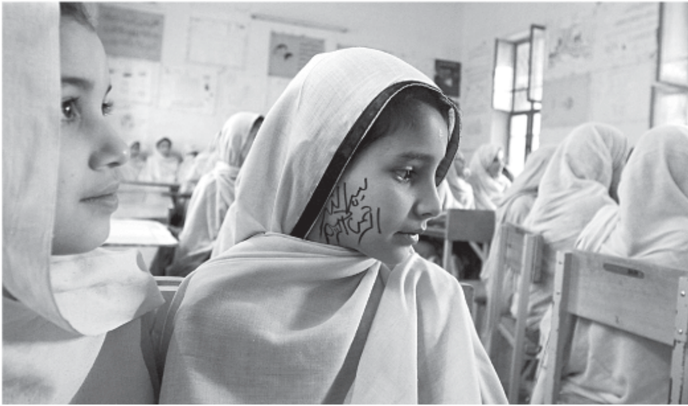
PARA siswi belajar di sebuah sekolah menengah atas negeri khusus putri di Mingora, Lembah Swat, Pakistan, Sabtu (11/10). Beberapa jam setelah Malala Yousafzai dianugerahi Penghargaan Nobel Perdamaian Jumat kemarin, warga di kampung halamannya bergembira merayakan perempuan muda dari lingkungan konservatif mereka telah memenangkan pengakuan internasional atas perjuangannya untuk hak pendidikan bagi perempuan.