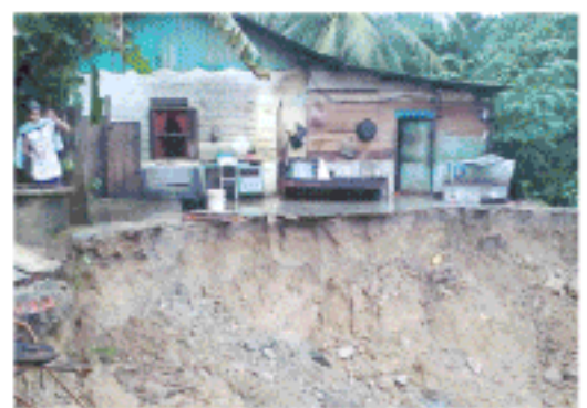
BAGIAN Dapur rumah warga di Desa Blang Gunci Kecamatan Paya Bakong, Aceh Utara ambruk ke sungai. Foto direkam Minggu (12/10).

Sementara itu, Kepala Badan Penanggulangan Bencana Daerah (BPBD) Aceh Utara, Munawar Ibrahim, menyebutkan sudah mengusulkan anggaran ke pemkab mengatasi persoalan tersebut, tapi karena tak ada dana lagi sehingga pihaknya telah menyampaikan ke pusat. "Supaya lebih akurat besok saya akan turunkan petugas ke lokasi itu untuk mendata kembali. Saya juga akan menyampaikan persoalan itu kembali ke pusat, semoga nantinya persoalan itu dapat ditangani," katanya. (j)