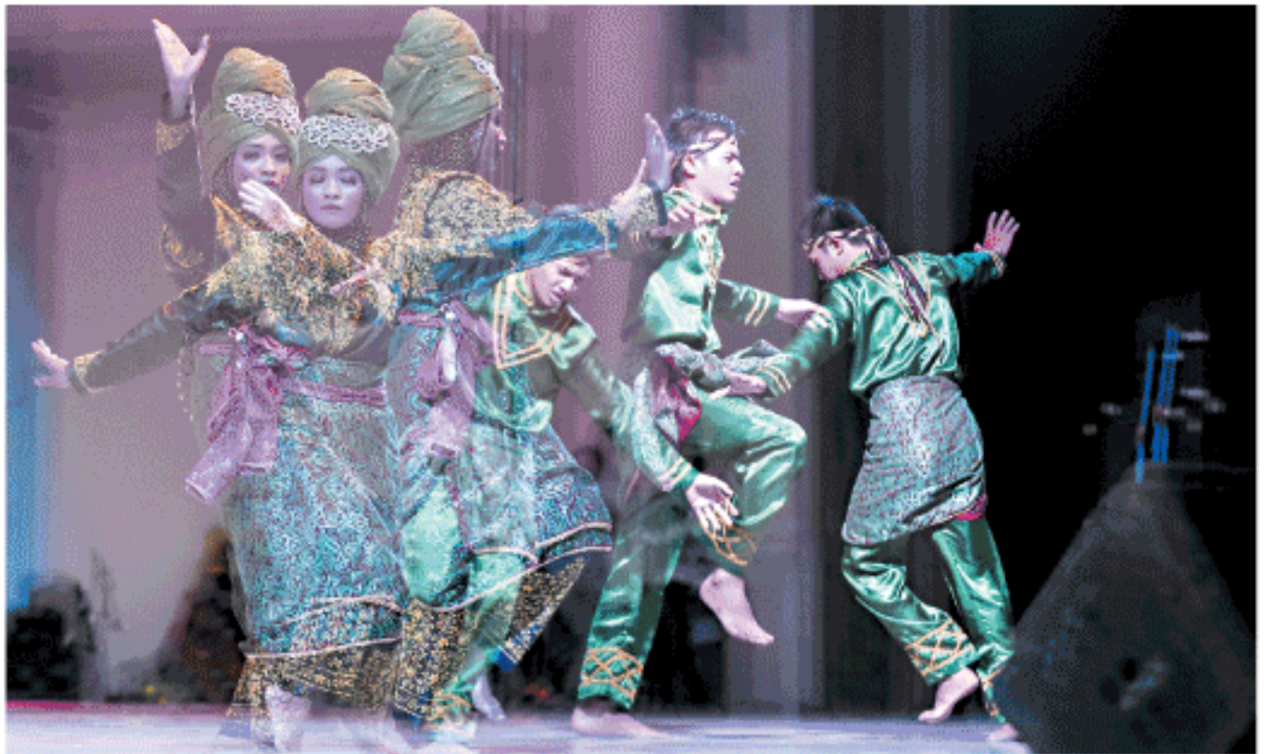
PENARI dari Sanggar Mausaho Ganto Kabupaten Aceh Barat menampilkan Tari Sidalupa pada Pentas Barat Raya (Aceh Barat, Aceh Jaya, Nagan Raya, dan Simeulue di Ratu Safiatuddin, Banda Aceh, Sabtu (11/10/2014) malam. Pentas kesenian daerah yang menampilkan kesenian dari 23 kabupaten/kota tersebut digelar oleh Disbudpar Aceh sejak 12 Agustus 2014 hingga November 2014 mendatang.