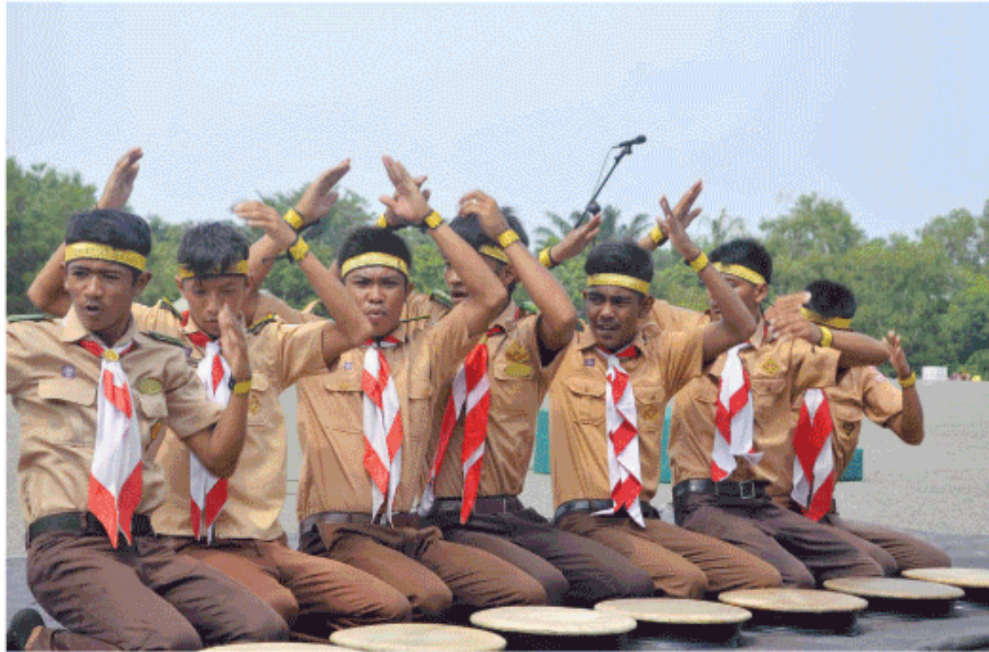
ANGGOTA Pramuka menampilkan tari rapai dan tari saman pada penutupan kegiatan Perkemahan Bersama Saka Wira Kartika yang digelar di Bumi Perkemahan Detasemen Arhanud-001, Pulo Rungkom, Kecamatan Dewantara, Aceh Utara, Minggu (12/10).

"Disamping juga kita akan berupaya meningkatkan hubungan dengan berbagai pihak terkait, sehingga perkembangan perusahaan air minum di Aceh Utara bisa terus berkembang secara baik," demikian Zainuddin. (bah)