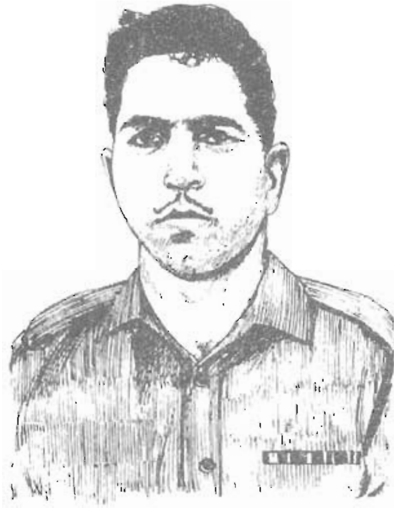
لانس نائیک محمد محفوظ شہید نشان حیدر

تعلیمات کا اکثر پرچار کرتے ہیں اور جب مرشد کی یاد میں بہت محو ہوں تو ان کا یہ نعتیہ مصرعہ در زبان ہوتا ہے