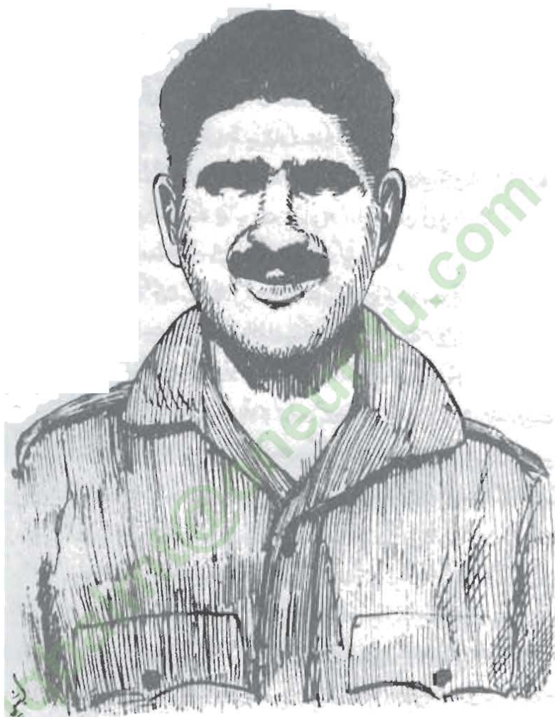
سوار محمد حسین شهید نشان حیدر