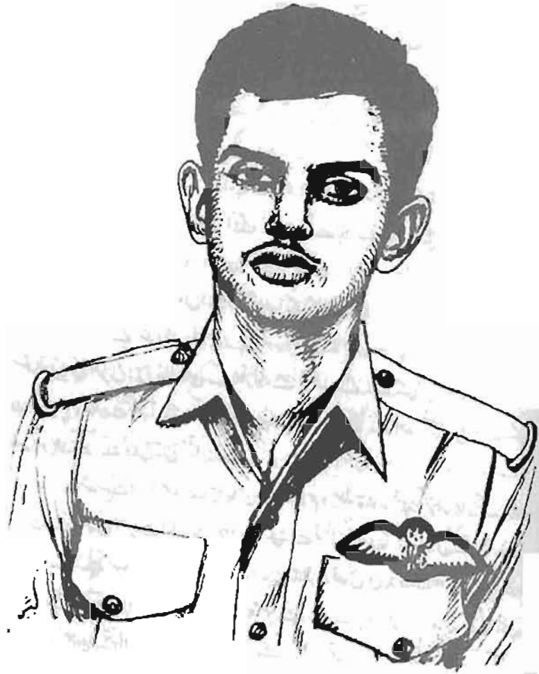
پائلٹ آفیسر راشد منہاس شہید نشان حیدر