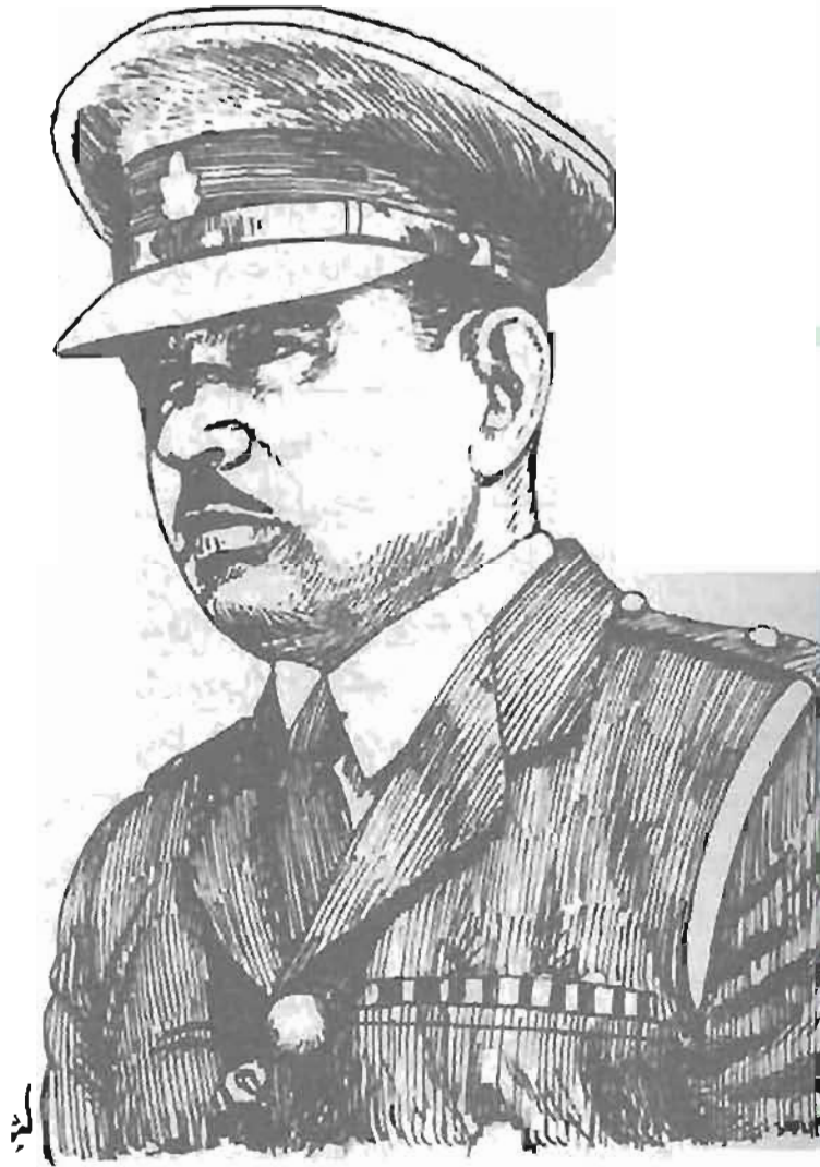
میجر چودھری طفیل محمد شہید نشان حیدر