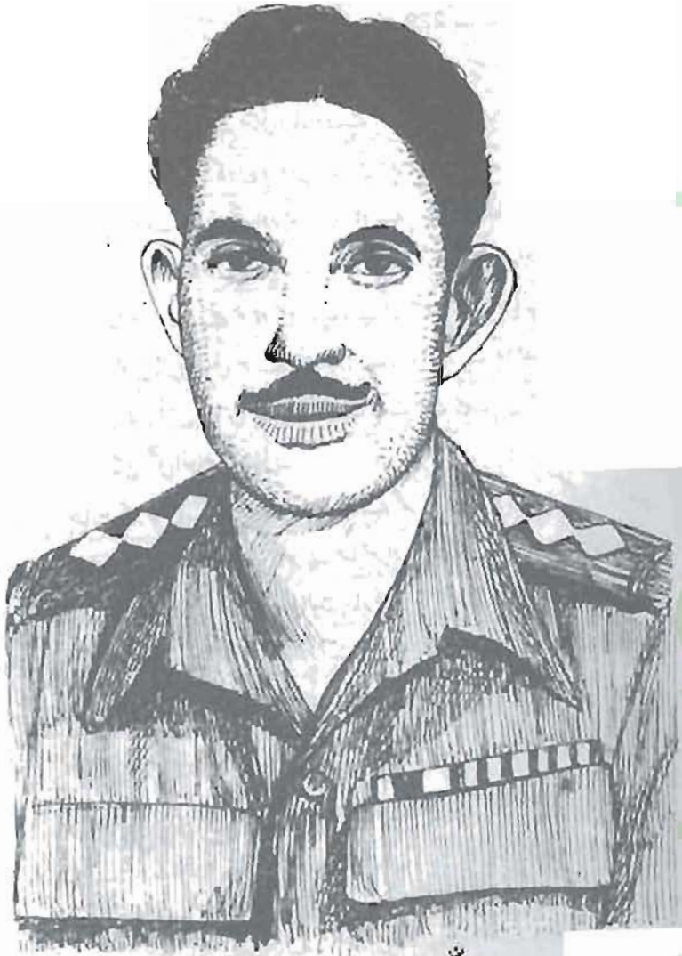
کیپٹن راجہ محمد سرور شہید نشان حیدر