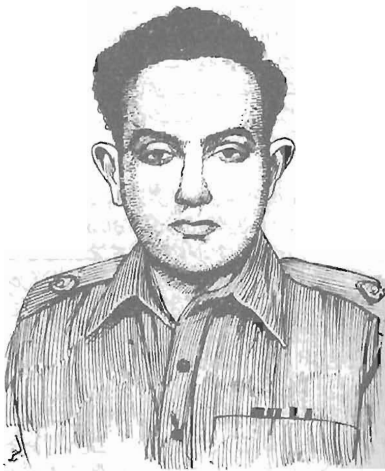
میسجر راجہ عزیز احمد بھٹی شہید نشان حیدر